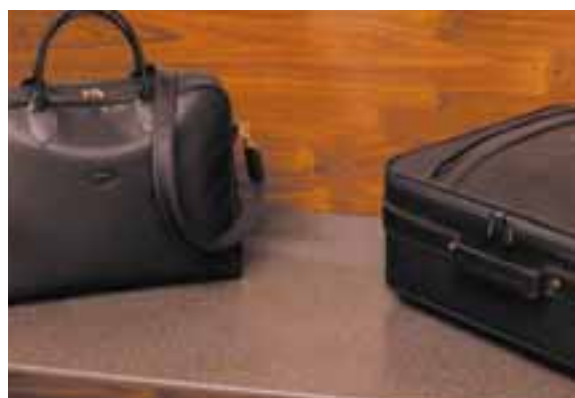
ÉTAGÈRE DE RANGEMENT POUR BAGAGES EN CORIAN® CANYON.