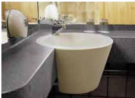
HÔTEL RADISSON SAS ROYAL VIKING, STOCKHOLM, SUÈDE. DESIGN SNICKARBOLAGET. PLAN DE TOILETTE ET LAVABO EN CORIAN® CAMEO WHITE ET CORIAN® GRAY FIELDSTONE.