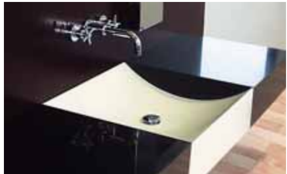
LAVABO "ZEN", MILAN, ITALIE. DESIGN MASSIMO FUCCI. VASQUE EN CORIAN® NOCTURNE ET CORIAN® BONE.

Se mariant idéalement avec le bois, l'inox ou le verre, Corian® crée des ensembles originaux. Que l'on opte pour le coup de fouet revitalisant d'une douche ou pour le délassement d'un bain, Corian® et les formes qu'il permet de façonner procurent une expérience inoubliable.