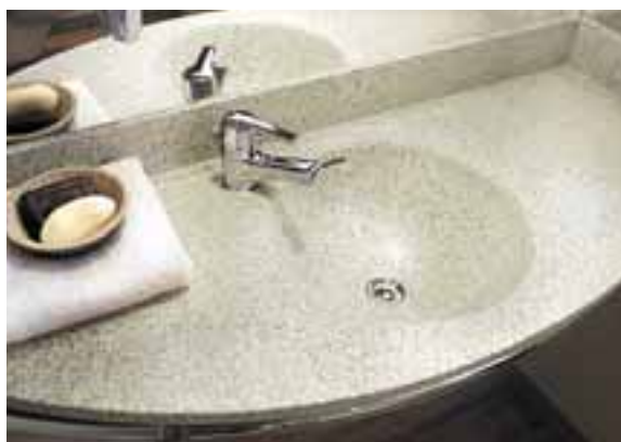
NOVOTEL, ROTTERDAM, PAYS-BAS. PLAN-VASQUE "TOUT EN UN" EN CORIAN® PYRENEES.

Sur le plan fonctionnel, Corian® garantit une hygiène irréprochable. Ses éléments massifs et non poreux s'assemblent sans joints perceptibles, créant ainsi des lavabos intégrés et des plans-vasques d'une pièce, simples et faciles à nettoyer et à entretenir.