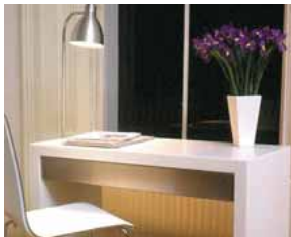
"TABLESTORE", LONDRES, ROYAUME-UNI. DESIGN ADRIAN WRIGHT. COLLECTION BRILLIANT SLAB EN CORIAN® GLACIER WHITE.