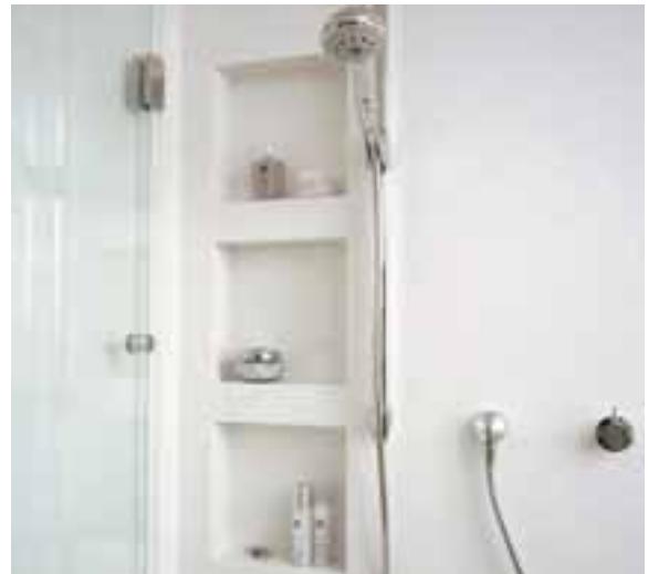
PAROIS DE DOUCHE INTÉGRALES AVEC ÉTAGÈRES INCORPORÉES. DESIGN CHARLES ZÄCH.