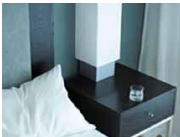
TABLE DE NUIT EN CORIAN® NOCTURNE.

Ici, une table de nuit profile ses contours nets et épurés; là, une étagère design épouse avec goût les contours d'un angle serré; là encore, la tablette du bureau accueille l'ordinateur portable comme le plateau du service d'étage.