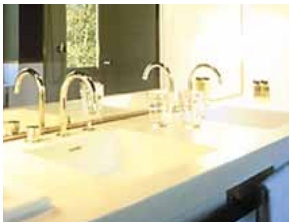
"THE HOTEL", LUCERNE, SUISSE. DESIGN JEAN NOUVEL. PLAN DE TOILETTE ET VASQUE D'UN SEUL TENANT EN CORIAN® GLACIER WHITE.